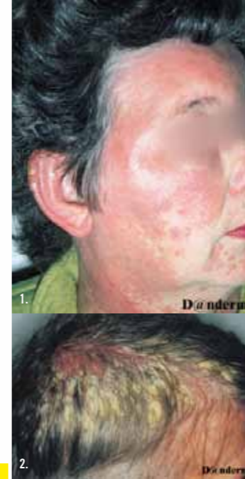
1. PPD Eczeem en 2. Seb Eczeem